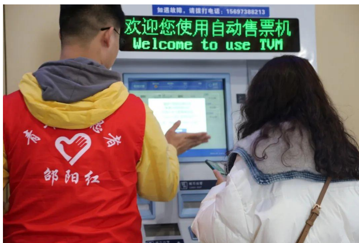
志愿者正在引导旅客使用自动售票机

随着春运结束，由共青团邵阳市委、邵阳市春运办、邵阳紫薇花服务队、邵阳市义工联合会承办的邵阳市2024年“暖冬行动”春运志愿服务已经圆满收官！