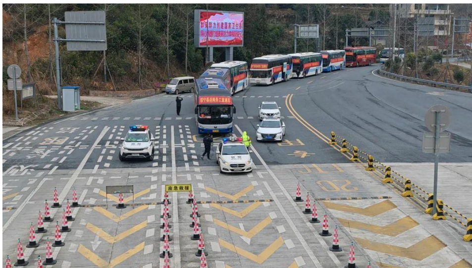
高速交警牵引车辆与返岗复工直通车正在绥宁收费站入口整备待发

2月27日，邵阳高速警察支队联合绥宁县开展2024年“春风行动”免费直通车助力劳动者返岗务工护航行动。