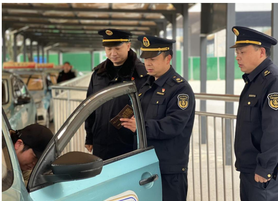
市交通运输综合行政执法支队执法人员在邵阳火车站检查出租汽车

春运期间，全市交通运输综合行政执法队伍每天出动数百名执法人员，以火车站、汽车站、高速收费站出入口、学校、医院等周边为重点执法巡查区域，采取定点执法与机动巡查相结合的方式，强力开展道路运输领域“打非治违”专项行动，加强道路运输市场监管执法，深入开展交通运输市场秩序整治，依法从严查处非法营运、客运车辆违规异地经营、违规涨价、站外揽客等违法违规行为，切实保障市民平安出行和学生平安返校。