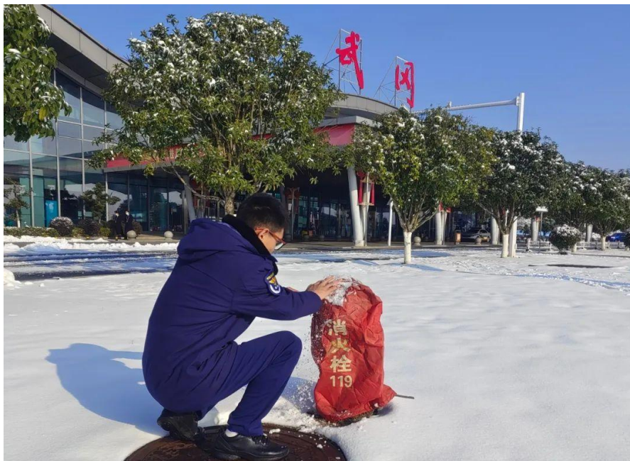
安全人员对消防设施进行维护保养检查

2024 年 3 月 6 日，历时 40 天的春运落下帷幕，邵阳机场圆满完成 2024 年春运保障工作。春运期间，邵阳机场共保障航班起降 222 架次、旅客吞吐量 19142 人次，同比分别增长 83.82%、191.53%。