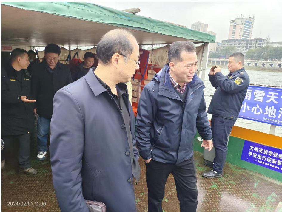
省春运检查组在北塔区九江码头渡船上询问了解春运开展情况

2月1日至2日，由省应急管理厅二级巡视员黄方明带队的省春运检查组来我市检查春运工作。检查组先后到G60沪昆高速隆回服务区、武冈机场、武冈西收费站、高速交警洞口大队、邵阳汽车东站、市邮政公司邮区中心局、九江渡口、邵阳汽车南站、邵阳火车站，重点围绕运输服务保障、安全措施落实、隐患排查治理、应急处置演练等方面开展实地检查。